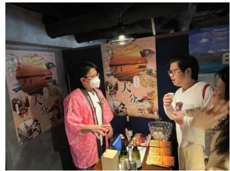
大分焼酎の説明を熱心に聞く来場者