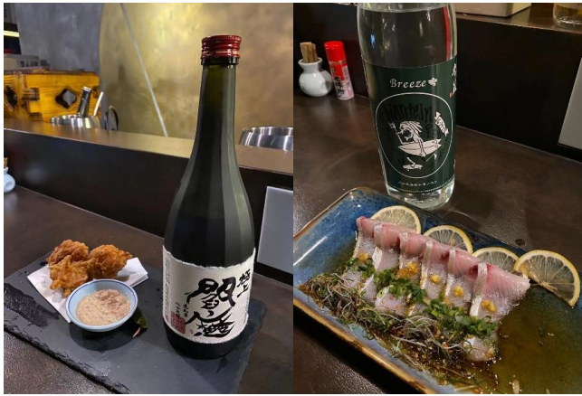
郷土料理のプレゼンテーションも秀逸

また、芋焼酎コーラ割りなど日本では思いもよらない飲み方が生まれることがあるそうです。中国人の嗜好に合った飲み方提案、中華料理とのカップリングといった方法も含め、様々なアプローチで日本・大分の焼酎を中国に広めていきたいと思えます。