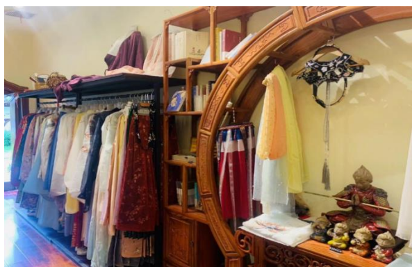
「時見鹿書店」 - 伝統文化体験館 (漢服体験)

注：四合院（しごういん）とは、四つの面に家屋があり、あるいは四つの面が壁に囲まれた家屋のこと。四合院の「四」の字は、東西南北の四面を表し、「合」は取り囲むという意味。