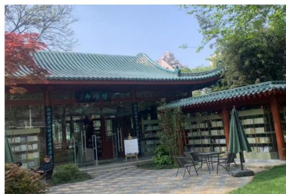
「時見鹿書店」 - 本屋、読書スペース