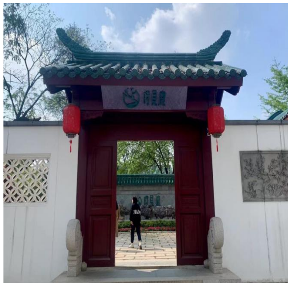
「時見鹿書店」 - 入口

この解放公園支店は、他の3店舗の現代的な雰囲気と違い、中国伝統建築である四合院 注 を意識した作りで、青い瓦と赤い柱、シンプルながらも古典的な美しさが備わっており、タイムスリップしたような空間です。敷地面積7000㎡、園内はカフェ、本屋、読書スペース、伝統文化体験館等、一日遊んでも飽きない、本と中国伝統文化のテーマパークです。