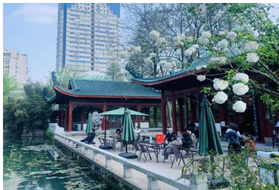
「時見鹿書店」 - 屋外レストラン