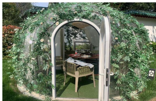
「時見鹿書店」 - 読書スペース