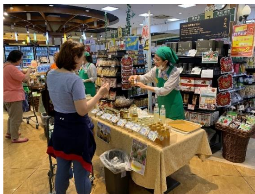
←H30年度に開催した 大分フェアの様子 (裕毛屋店舗内)